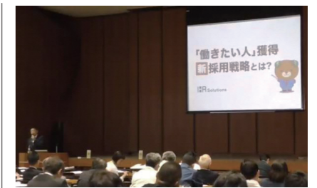
県内中小企業向けのセミナーの様子

セミナーの効果もあり、“あのこの愛媛”への求人掲載企業数は実証開始後1カ月で約140社だったものが、実証開始後1年で約850社に増加し、年間2,500件程度の雇用のマッチングが成立している。