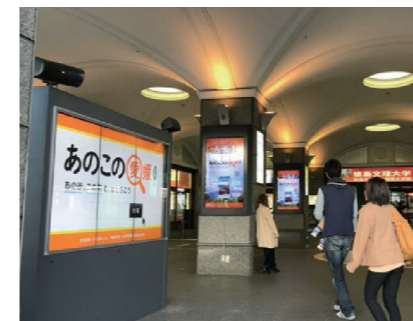
伊予鉄道駅コンコースでの“あのこの愛媛”広告

オーロラビジョン、県内自治体の広報誌などを活用して、積極的な広報・PR活動を行った。