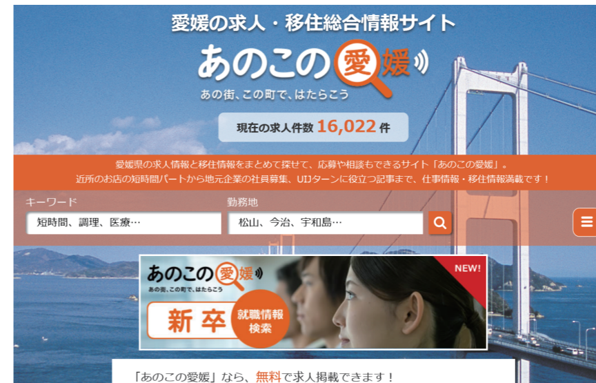
求人・移住総合情報サイト“あのこの愛媛”

“あのこの愛媛”や“えひめのあぶり”を幅広く活用してもらい、アクセサデータを多く収集するため、駅コンコース、県内広報番組、街中