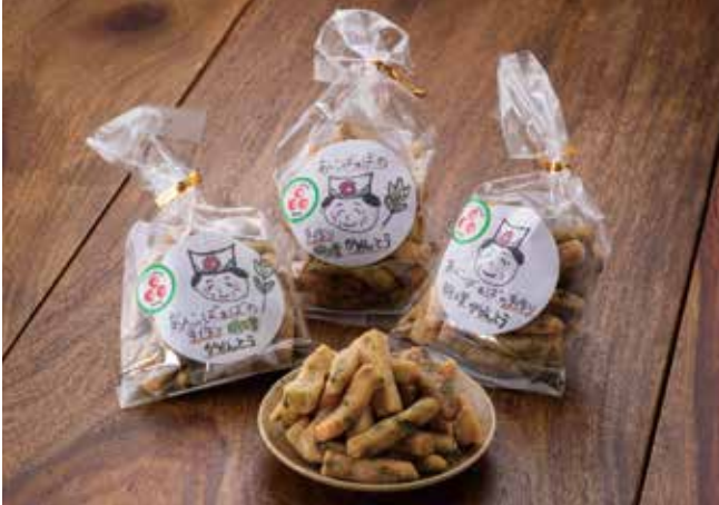
明日葉のほのかな香りとサクサク感をお楽しみ下さい