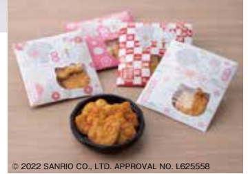
© 2022 SANRIO CO., LTD. APPROVAL NO. L625558