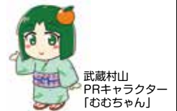
武蔵村山 PRキャラクター 「むむちゃん」