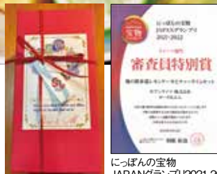
にっぽんの宝物 JAPANグランプリ2021-2022 ギフトにも喜ばれています。スイーツ部門 審査員特別賞受賞

卵は三鷹市の平飼卵を使用し、北海道産小麦と国産レモンを手絞りしたレモン果汁を使用しています。