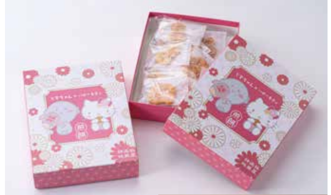
© 2022 SANRIO CO., LTD. APPROVAL NO. L625558