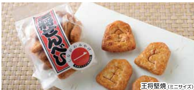
王将堅焼 (ミニサイズ)