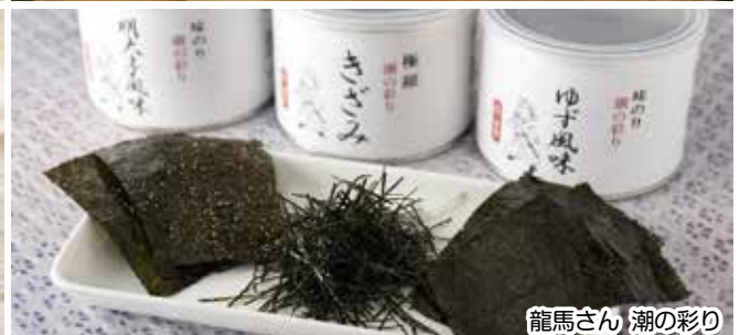
龍馬さん 潮の彩り

こころをこめた、味と技、しながわの元気を、詰め込んだ、「しながわみやげ」。2013年より認定が始まり、せんべいや和洋菓子といった食品から、漆器、人形といった品川ならではの当地グッズまで、約100の様々な商品が認定されています（2023年10月末現在）。みやげ話のおともに、贈り物に、大活躍してくれること、請け合いです。