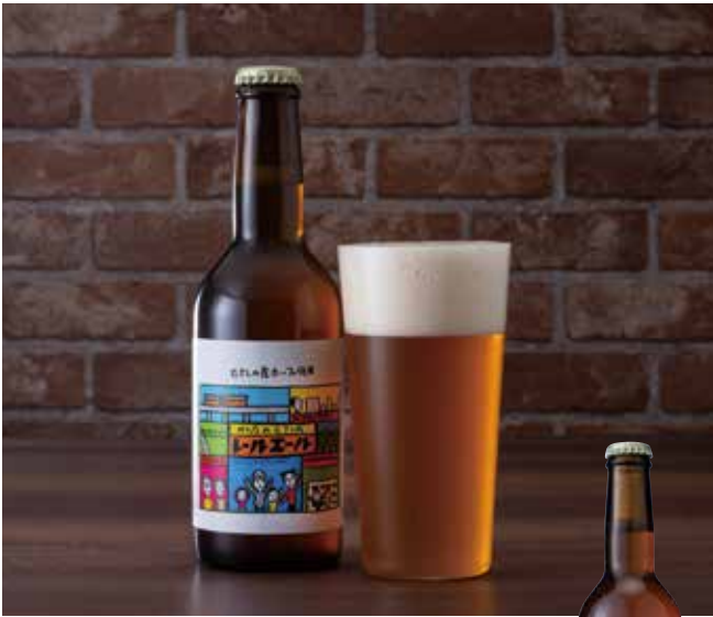
ラベルデザインは、吉祥寺を代表するイラストレーター キンシオタニさん書下ろし。