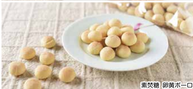
素焚糖 卵黄ボーロ