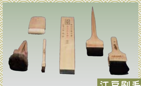
江戸刷毛 えどはけ

東京の伝統工芸品は、長い年月を経て、東京の風土と歴史の中で生まれ、時代を越えて受け継がれた伝統的な技術・技法により作られています。現在、41品目が東京都伝統工芸品の指定を受けています。