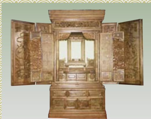
東京仏壇 とうきょうぶつだん