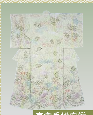
東京手描友禅 とうきょうてがきゆうぜん