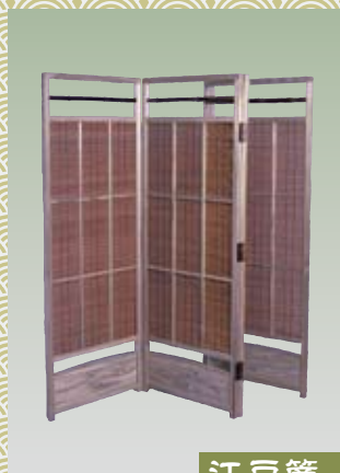
江戸簾 えどすだれ