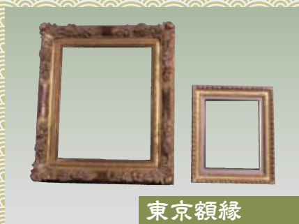
東京額縁 とうきょうがくぶち