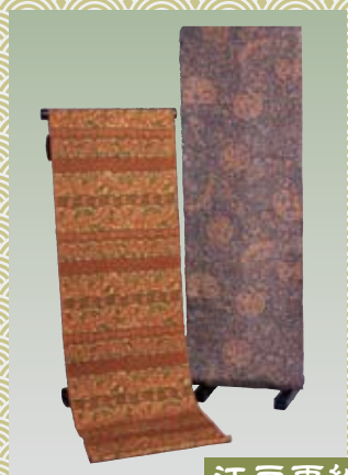
江戸更紗 えどさらさ