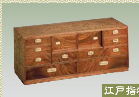
江戸指物 えどさしもの