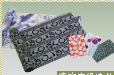
東京本染ゆかた とうきょうほんぞめゆかた