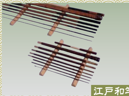
江戸和竿 えどわざお