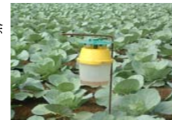
フェロモンを利用した害虫の誘殺防除