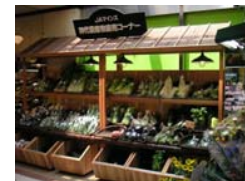
インショップの販売コーナー