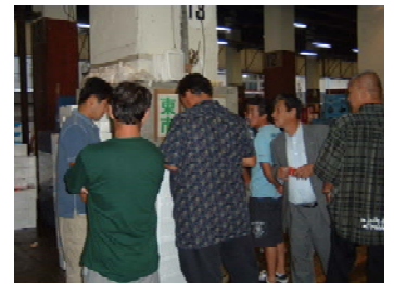
市場関係者と協議

トローリング大会の検討及び開催には、集落の漁業者だけでなく、観光協会、商工会、釣宿、行政等様々な参加者の連携のもとで行い、参加者数が増加したことにより、島全体の活性化に寄与してきている。加工品の取組は、学校給食を中心に販路の開拓が進んでおり、漁業者の収益向上だけでなく、参加者のやりがいにもつながっており、今後の進展が期待できる。漁業者自らが漁獲物の出荷や販売について、市場関係者と話し合いを行うことで漁獲物の鮮度保持や出荷形態の改善に対して、積極的に取り組むようになり、一部の魚種で市場価格の向上につながった。