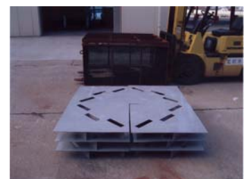
アワビ養殖礁シェルター

東京都島しょ農林水産総合センターの指導を受け、飼育行なっており、商品サイズまでの飼育期間は、約3～4年を見込んでいます。アワビは島民のみならず来島者にも買入者が多く、通年販売による計画的な出荷が可能になり、高齢漁業者の操業意欲を保つことに繋がると期待している。