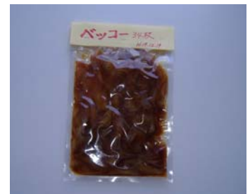
試作品（ブダイのベッコー）

ウツボの干物やブダイのベッコー(調味液漬け)等の加工品を開発し、試作品の発表会を行った。この発表会には、多くの人が参加し、取組への認識が進み、今後の加工品開発につながる様々な意見が聞くことが出来た。