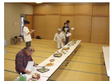
料理コンテスト審査