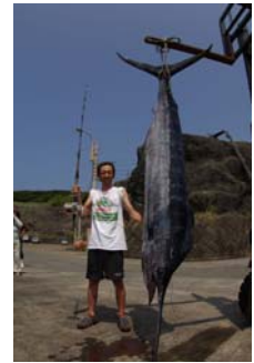
トローリング大会釣果