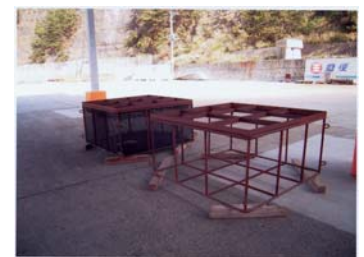
アワビ養殖礁フレーム

漁業者の高齢化に伴い、操業が容易で収益が得られるものとして、採る漁業から作り育てる漁業への転換を視野に置いており、アワビが市場で高価取引種であることから養殖への取組みを開始した。