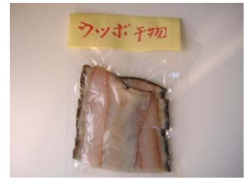
試作品（ウツボの干物）