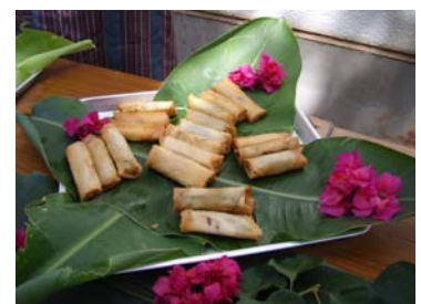
料理コンテスト最優秀作品

メカジキ料理コンテストでは、応募者を募ることでメカジキの食材としての普及効果を得ることが出来、さらに母島フェスティバルにおいて入賞作品を提供したことにより、イメージアップが図ることができた。