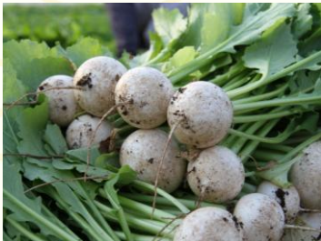
栽培も収穫も愛情を込めて