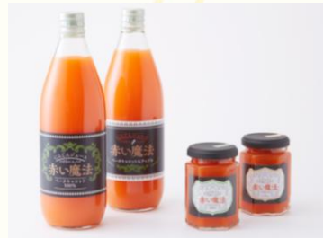
栽培したニンジン为原料にしたジュースとジャム