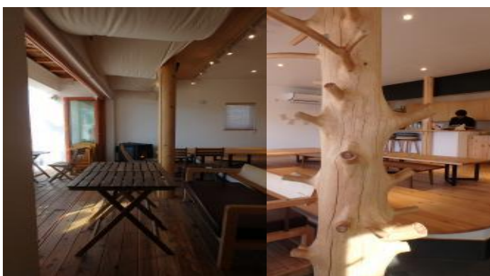
会場には、ペレットストーブがあります