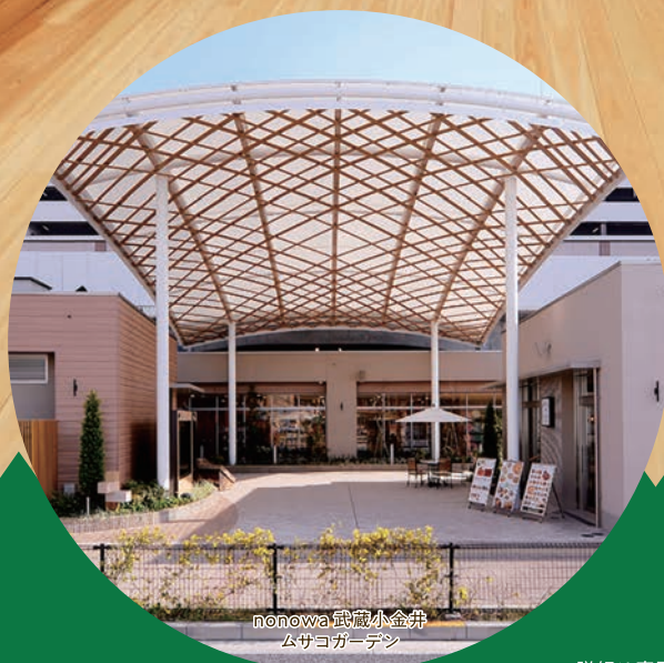
nonowa 武蔵小金井 ムサコガーデン