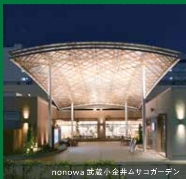
nonowa 武蔵小金井ムスコガーデン