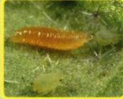
ショクガタマバエ