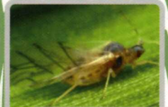
ヒエノアブラムシ