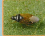
ヒメハナカメムシ