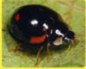
ダンダラテントウ