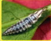
ヤマトクサガゲロウ