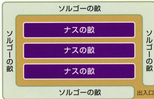
ソルゴーを活用したナスほ場 イメージ図

露地ナスは栽培が長期にわたり、アザミウマやアブラムシ、ハダニなどの害虫も多く、薬剤の散布回数が多い作物です。近年、ナス畑の周囲にソルゴーを栽培し、土着天敵を活かした減農薬栽培が進んできています。ソルゴーのは種時期・品種選択、害虫と天敵の知識などへの理解が必要ですが、これらの技術を活用して、農薬散布回数を削減したナス栽培に取り組みましょう。