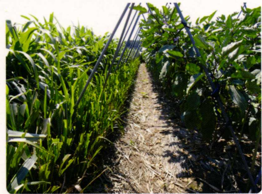
ソルゴーで囲われたナスほ場