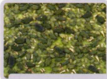
トウモロコシアブラムシ