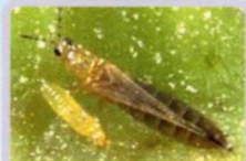
ヒラズハナアザミウマ