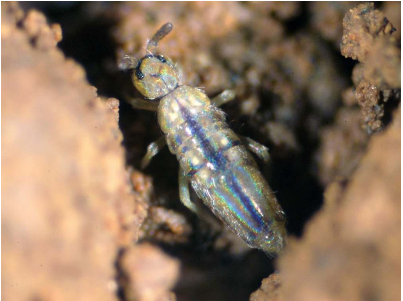
第4図 成虫（体長最大約 2.5mm. 遠目には灰色に見える. 注：この個体は触角が折れている）