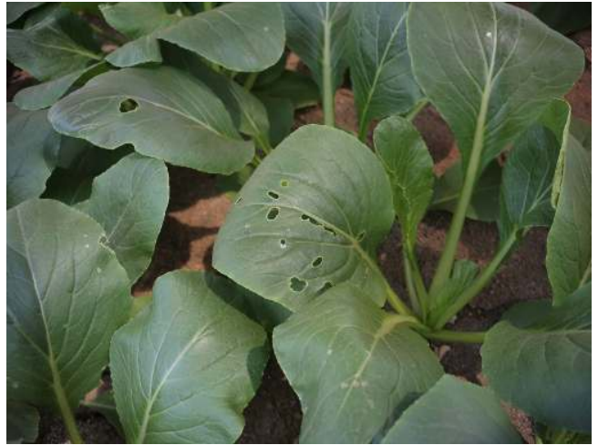
第2図 コマツナの被害の末期（穴が拡大する）