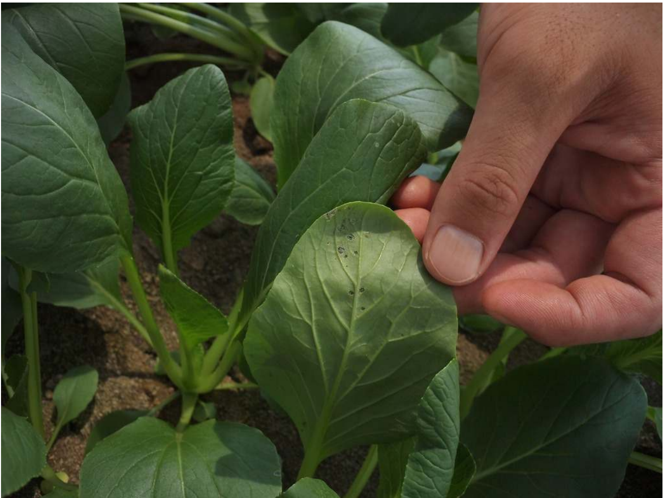
第3図 被害初期には葉裏に本種がいることが多い