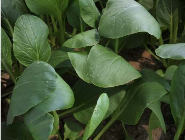
第1図 コマツナの被害の初期（穴が小さい）