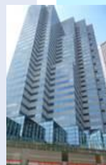
新宿エルタワービル