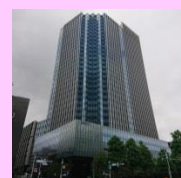
コモレ四谷 四谷タワー