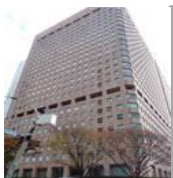
小田急第一生命ビル