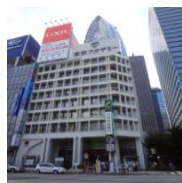
松岡セントラルビル