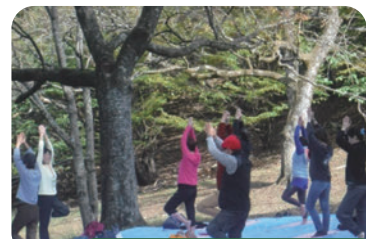
森林セラピーイベント

上記のほか、暮らしの中で多摩産材を使っただけなくとも、花粉の少ない森づくりにつながります。