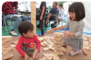
東京おもちゃまつり