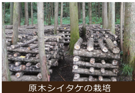
原木シイタケの栽培