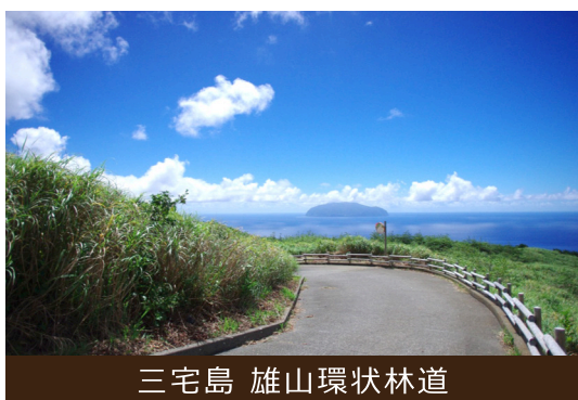
三宅島 雄山環状林道