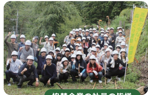
協賛企業の社員の皆様