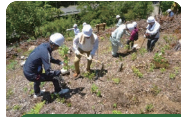
企業の森における植栽活動