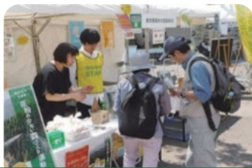
みどりとふれあうフェスティバル（日比谷公園）