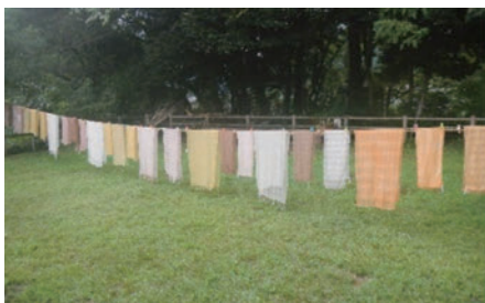
草木染めのスカーフ