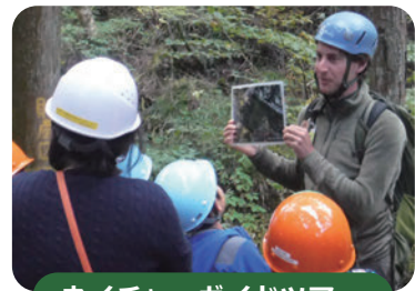
ネイチャーガイドツアー