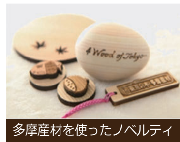
多摩産材を使ったノベルティ