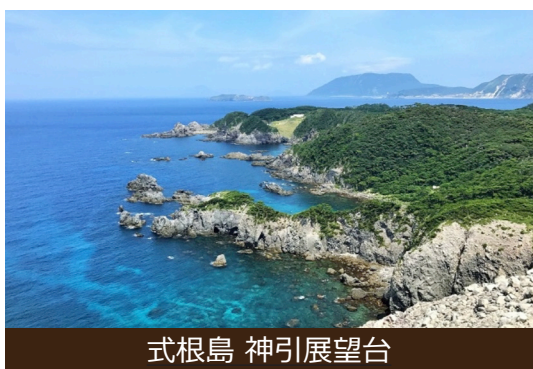
式根島 神引展望台