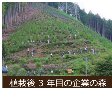
植栽後3年目の企業の森