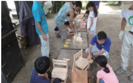
木製の椅子づくり体験