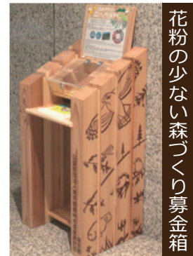
花粉の少ない森づくり募金箱