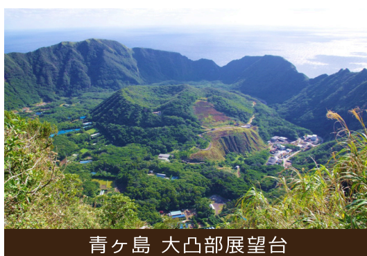
青ヶ島 大凸部展望台