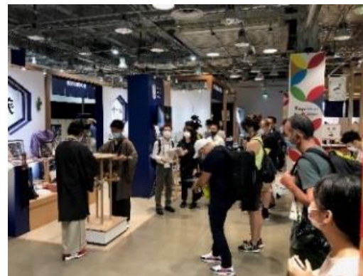
・東京スポーツスクエア (R3.7～9)