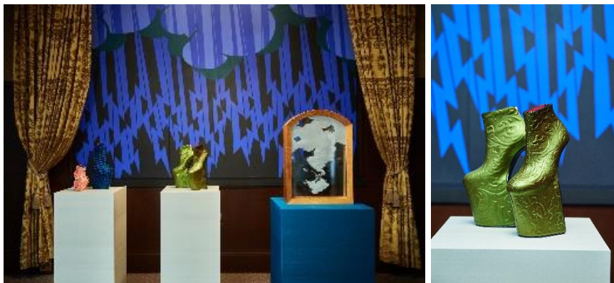
・江戸東京リシンク展 (R3.2～3)