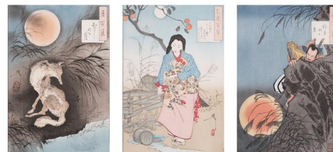
PRINTS FROM TSUKIOKA YOSHITOSHI'S SERIES "ONE HUNDRED ASPECTS OF THE MOON" REPRODUCTION PRINTS MADE BY TAKAHASHI KOBO