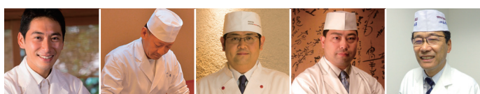
大森海岸 松の鮨 神楽坂 天孝 宗胡 日本橋ゆかり 人形町今半

27日(土)・28日(日) 11:00-17:00 ・売り切れになり次第販売終了となりますのでご了承ください。