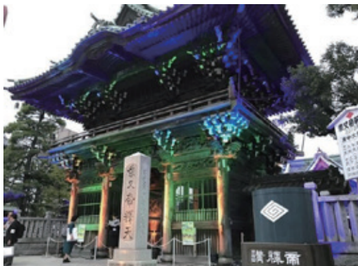
ショーケースイベント（柴又帝釈天）