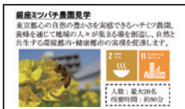
SDGs 関連コンテンツの一部