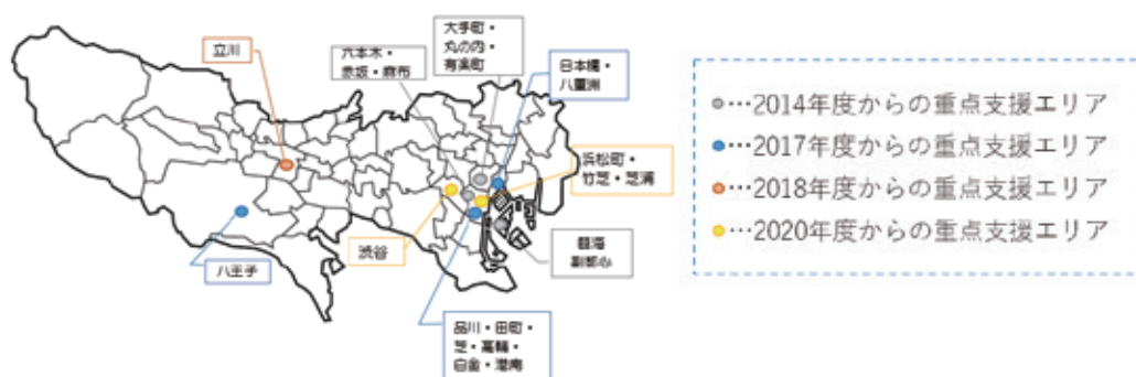
MICE開催拠点地域の指定