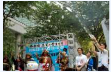
真夏の雪まつり(2018年8月)