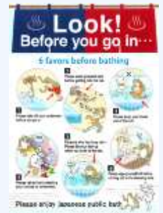
入浴方法案内リーフレット