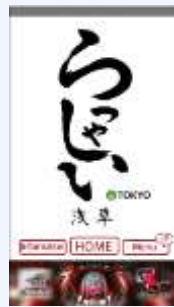
アプリ(らっしやい浅草)