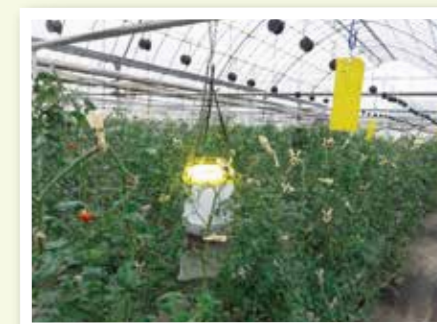
▲黄色蛍光灯による害虫防除