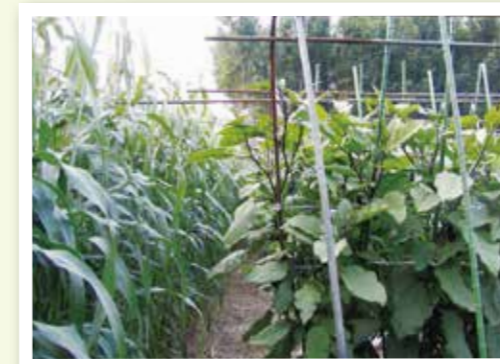
▲バンカープランツによる農薬削減

※養液栽培では、土づくり、化学肥料削減の技術に代えて、養液栽培の認証基準を満たすもの